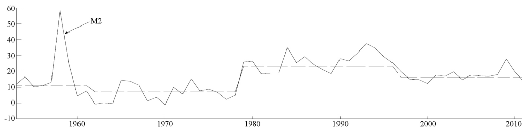
图2 货币增长率分段图

在中国,作为货币政策中介目标的货币供给量一直是政府调控经济较常用的手段,尤其是金融危机过后,扩张性货币政策更是频繁地被货币当局用来促进经济增长、增加就业。但是,只有识别不同经济条件下调控货币供给增长率的不同影响效果,对货币政策的效力进行较好的评估才可以为政策制定者提供较好的参考。接下来我们根据上述断点检验结果以及间断点的确定给出在不同经济时期以及不同经济情况下,两种经济波动成分对政策冲击的脉冲响应对比图,据此分析中国的货币政策冲击对经济影响的时变特征。图3给出了1961年、1978年以及1996年的经济时点脉冲响应图,以期基于异质性货币供给冲击观测经济波动不同成分的时变特征。脉冲响应图显示了在各个时点上1单位正向货币供给增长率冲击下相关经济变量的响应:(1)对于不同时点的正向货币政策冲击,也就是采取宽松的货币政策,那么经济中的两种经济成分在初期都呈现出上升的趋势。(2)对于结构性成分来说,在初期逐渐上升,而后在滞后3期时达到最大,后出现了小幅下降,最后回归一个新的稳态水平。(3)对于周期性因素来说,在脉冲响应初期经济周期性波动上升,在滞后2期达到最大,并开始逐渐下降,到滞后4期左右转向了负值的水平,负值运行一段时间后逐渐向稳态水平靠近。(4)在不同的时间点,也就是不同的经济状态下,给定货币政策冲击,变量的相应幅度也存在差异。通过以上的对比可知,经济波动的结构性及周期性因素在受到货币政策冲击时,其响应效果存在较大差异。对于结构性成因构成的通货膨胀来说,采取逆向调控的措施可以起到较好的效果。而对于周期性因素来说,短期内受货币政策的影响较好,但是从长期看,其影响效果及影响方向出现了与预期相反的变动。所以,针对以上的分析,本文建议,在经